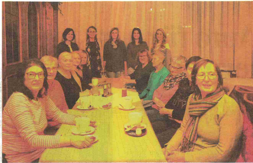
Gemütliche Stimmung am Frauenstammtisch.